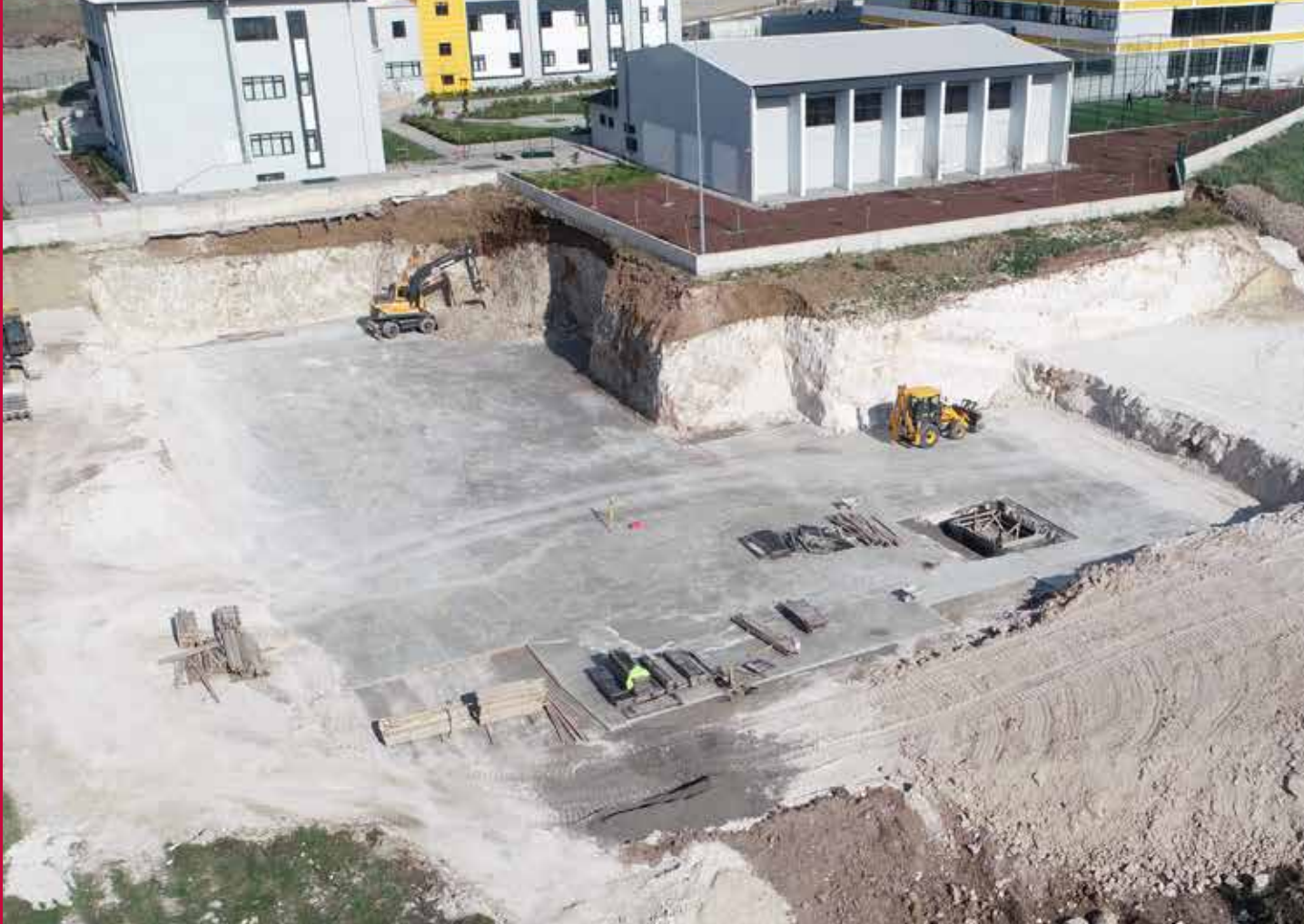
Meslek Lisesi Atölye