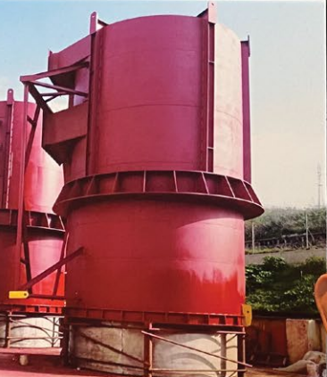
İZMİR MÜHENDİSLİK www.izmirmuhendislik.com.tr