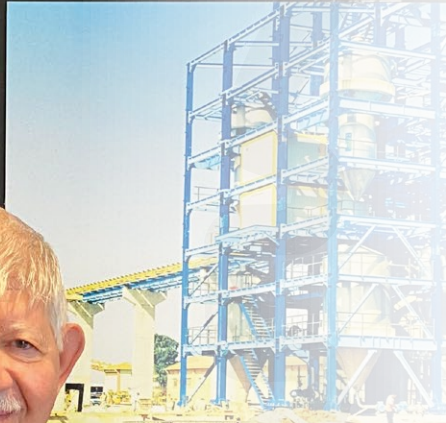
İZMİR MÜHENDİSLİK http://www.izmirmuhendislik.com.tr